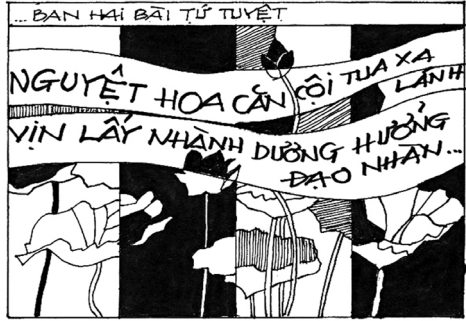
... ĐÀN HAI BÀI TỬ TUYẾT