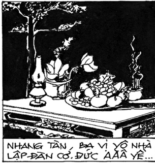
NHANG TÀN, ĐÀ VỊ YẾ NHÀ LẬP ĐẠN CỜ ĐỨC AAAAA YẾ...