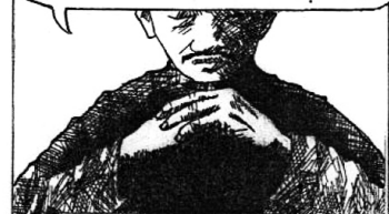
ĐỨC CAO ĐÀI TIÊN ÔNG ĐÀN CHO ĐÓN CẦU THƠ...

BẠCH THẦY, XIN THẦY CHO CHÚNG ĐỀ TỪ MỘT BÀI THÍ KỶ NIỆM CỐ TIÊN NHỮNG NGƯỜI DỰ ĐÀN