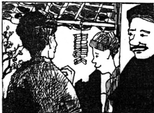
TÙNG NHÀ, TIÊN BỘI NGÔ VĂN CHIEU VÀ CẶP ĐỒNG TẬP CỤ, TÁC LẬP ĐÀN CƠ. ĐỨC CAO ĐÀI TIÊN ÔNG ĐÀN CHO MỖI VỊ, MỘT BÀI THÍ

CUỐI CÙNG, ĐẾN NHÀ TIÊN BỘI LÊ VĂN TRUNG THÌ VỪA KIP ĐÓN GIAO THỪA VÀ TẾT NGUYÊN ĐÀN BÌNH DẴN