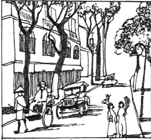
SÀI GÒN, CHIỀU 30 TẾT (2/1926)