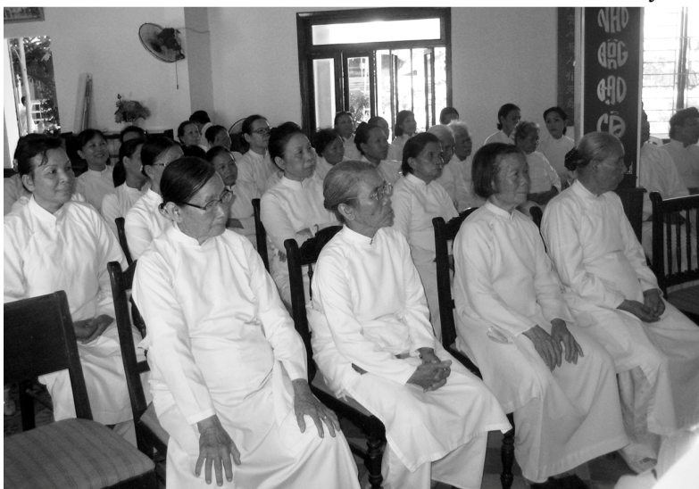
Quý đạo tỳ chăm chú theo dõi theo dõi buổi hội ngộ giao lưu.