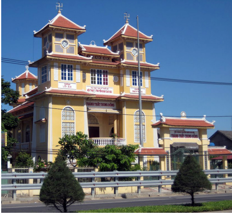
Thánh thất Trung Đồng 170 Trường Chinh, Cẩm Lệ, Đà Nẵng