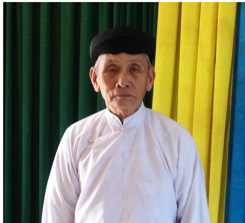
Lễ Sanh Thái Tân Thanh Đầu Họ Đạo thánh thất Trung Đồng