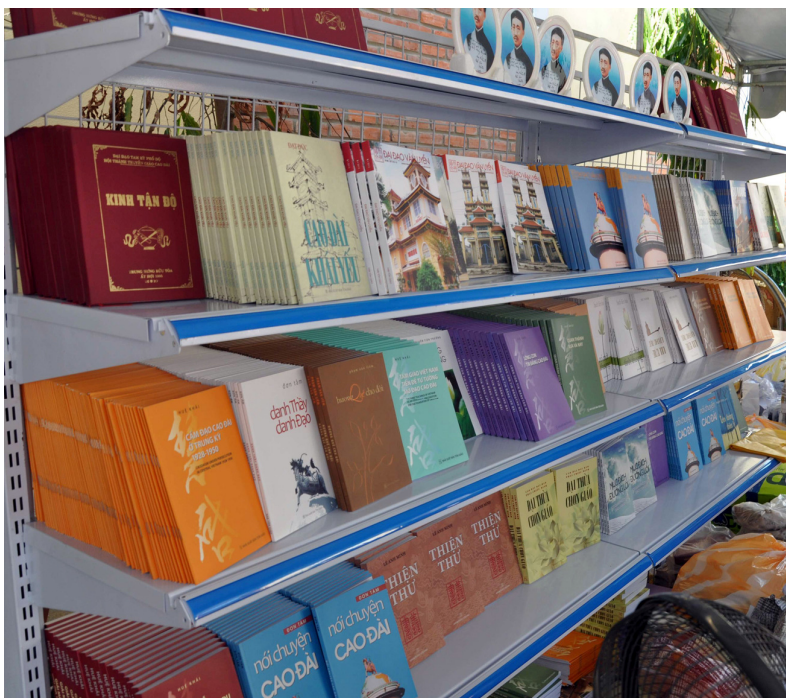
Sáng 18-5-2013: Quầy phát hành kinh sách ấn tống trong ngày lễ lạc thành thánh tịnh Trung Tông.