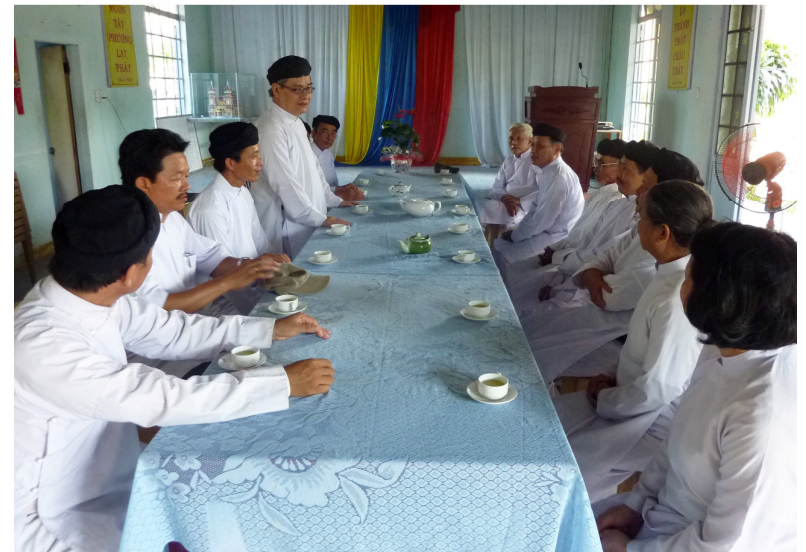
Đàm đạo, hỏi thăm về tủ kinh sách ấn tổng đặt tại họ đạo Trung Sơn.