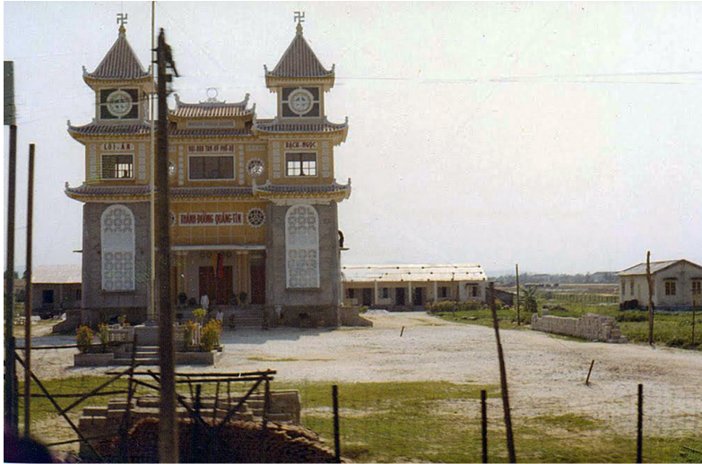
Thánh đường Quảng Tín 1969-1970. Nay là thánh đường Quảng Nam (Hội Thánh Truyền Giáo).

đời và đạo, chúng tôi được dự trọn vẹn một đại lễ hoành tráng và ấn tượng sâu sắc. Để rồi, khi chúng tôi vừa trở về Nam thì bão lớn phũ phàng liền đập vào miền Trung!