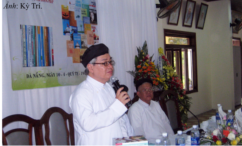
Thay mặt Ban Ân Tổng, Đh Huệ Khải kính lời tri ân Hội Thánh Truyền Giáo Cao Đài đã tổ chức buổi giao lưu kết quả mỹ mãn.