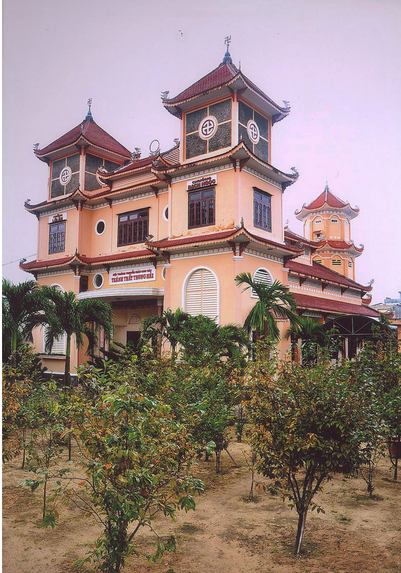
Thánh thất Trung Hải. Ảnh: Nguyễn Thế Tuấn