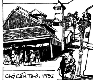
CHỢ CÁN THƠ, 1932

10-4-1932, SAU CHUYẾN THĂM TÀ LƠN LẦN HAI, NGỒ TIÊN BỐI VÀ CÁC ĐỆ TỬ VỀ LẠI CÁN THƠ