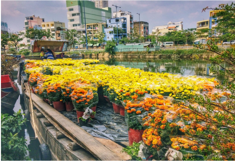
Chợ hoa ngày Tết