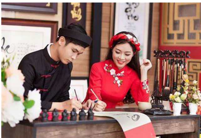
Ông Đồ ngày nay (Ảnh: Internet)

Trong những năm gần đây, khuynh hướng quay về cội nguồn văn hóa được khởi xướng trong giới trẻ Thành phố, và hình ảnh “ông Đồ” lại được tái hiện trong các lễ hội Tết, như tại Nhà Văn hóa Thanh niên Tp. Hồ Chí Minh. Đặc biệt, không chỉ có những ông đồ già áo the khăn xếp, mà còn có những ông đồ, bà đồ trẻ mặc áo dài, khăn đóng ngồi cho chữ, không chỉ cho chữ Hán, mà còn có thể cho chữ Quốc ngữ viết theo lối thư pháp, phục hồi tục cho chữ, xin chữ được khách du xuân hưởng ứng rất nhiều.