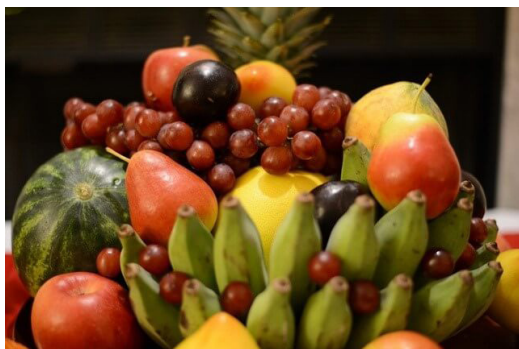
Mâm ngũ quả miền Bắc

- Ở miền Bắc, mâm ngũ quả được bày theo thuyết Ngũ hành trong văn hóa phương Đông, có nghĩa là vạn vật dung hòa cùng Trời Đất. Do đó, mâm ngũ quả thường phối theo 5 màu đó là: Kim màu trắng, Mộc màu xanh, Thủy màu đen, Hỏa màu đỏ, Thổ màu vàng. Người dân miền Bắc thường trang trí, sắp xếp màu sắc của từng loại quả xen kẽ với nhau để hợp phong thủy ngày Tết và bắt mắt. Thông thường mâm ngũ quả ở miền Bắc gồm 5 loại quả: chuối, bưởi, đào, quýt, hồng.