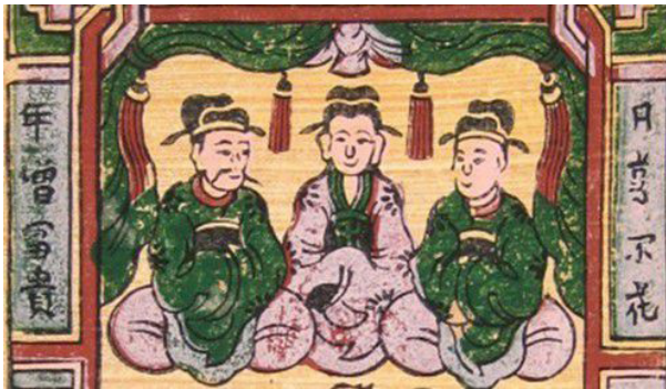
Ba vị Táo Quân -Tranh dân gian Đông Hồ

Để chuẩn bị đón Tết Nguyên Đán, ngay từ sau Rằm tháng chạp, không khí đón Tết đã trở nên nhộn nhịp, nhà nhà nô nức đi chợ mua sắm; sơn phết, trang hoàng nhà cửa, dọn dẹp bàn thờ tổ tiên... Người dân Việt còn có phong tục đưa ông Táo về Trời vào ngày 23 tháng Chạp. Việc thờ các vị Thần Táo Quân của mỗi gia đình thể hiện tín ngưỡng dân gian, mỗi nhà được hộ trì có cuộc sống đầy đủ, đầm ấm, hạnh phúc, đã trở thành một nét đẹp truyền thống văn hóa tâm linh dân tộc.